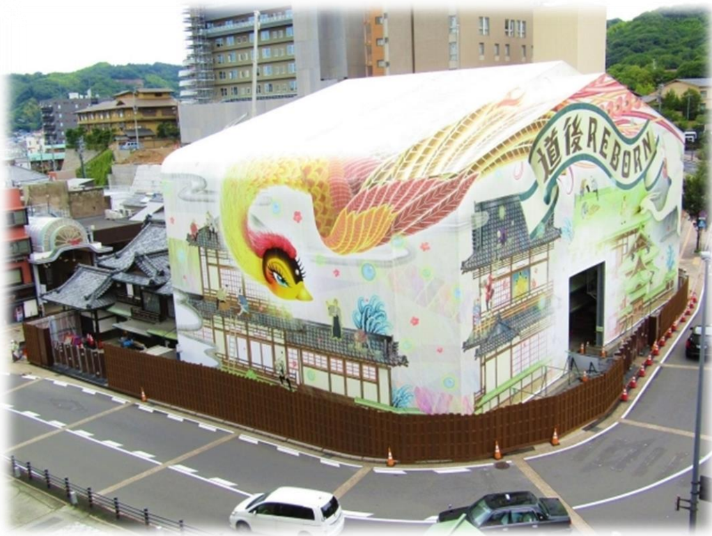
道後REBORNプロジェクト